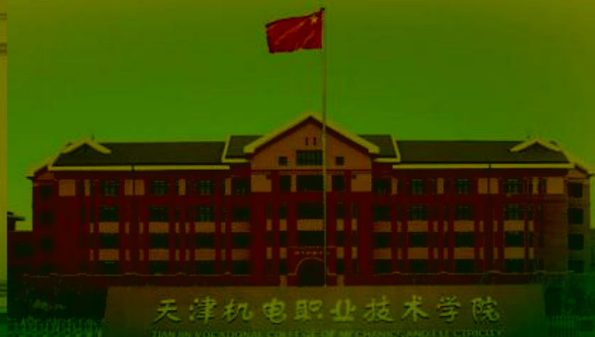
天津机电职业技术学院

TIANJIN VOCATIONAL COLLEGE OF MECHANICAL AND ELECTRICAL ENGINEERING